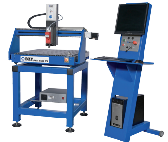
BZT PFE 500 mit Steuerungspult BZT PFE 500 with controlling device