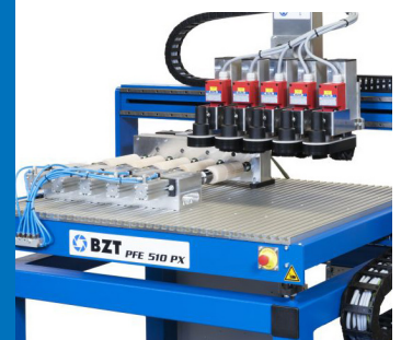
Mehrfarbearbeitung, BZT PFE Multiple machining, BZT PFE