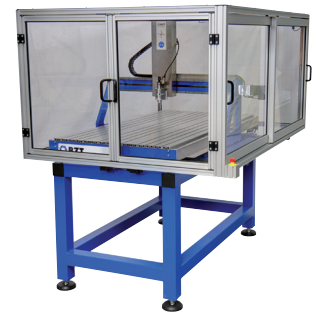
BZT PFE 1500 mit Einhausung BZT PFE 1500 with Housing