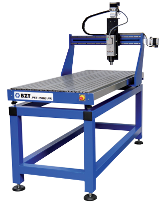
BZT PFE 1500, Portalerhöhung Z 250 mm BZT PFE 1500, Portal heightening Z 250 mm