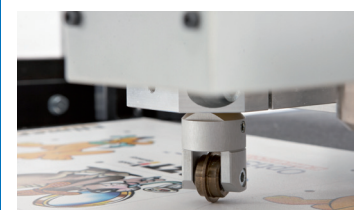
Schneidmodul, optional Cutting module, optional