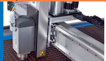
Z-Achse für HF-Spindeln bis 2,2 kW Z-Axes for HF-spindles up to 2,2 kW