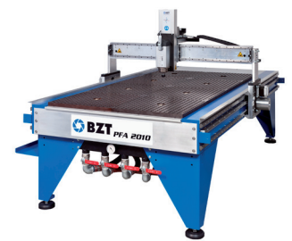
BZT PFA 2010 mit Vakuum-HD-Platte BZT PFA 2010 Vacuum HD plate