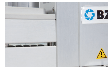
Passermarkenerkennung, optional registration recognition marks, optional